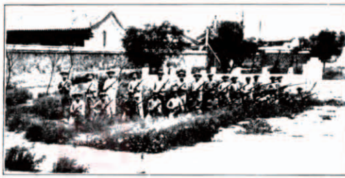
影合操體生年二第等高校學小一第立民津天