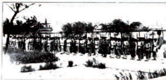
影合操體生年一第等高校學小一第立民津天

照陆军练习打靶以重军学而育人才 [13] ”那时的影像资料也记载了学校开展的兵式体操,见图1 [14] 和图2 [15] 。